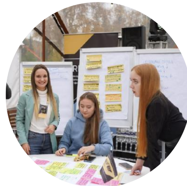
Молодежь PRO Север