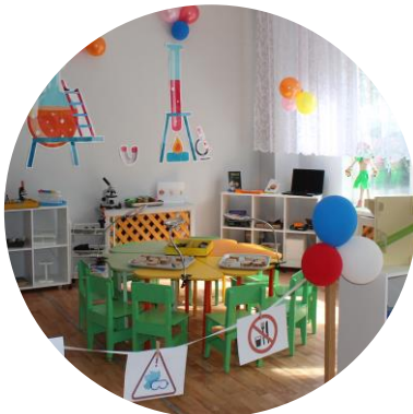
Район моей мечты