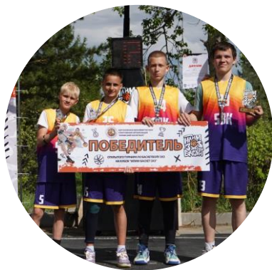
Энергия родной земли

Одной из мер повышения социальной поддержки населения Регионов присутствия является проведение грантовых конкурсов.